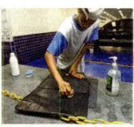
Simples. Para as forrações basta água e aspirador de pó