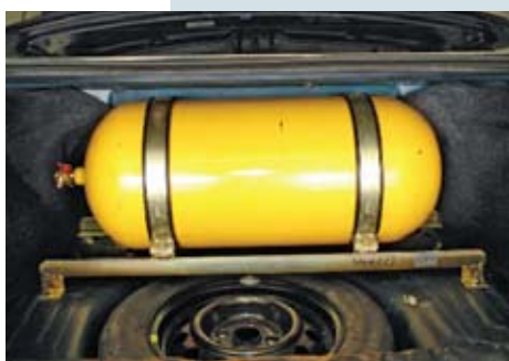
Por dentro do porta-malas