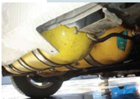
Por baixo do veículo