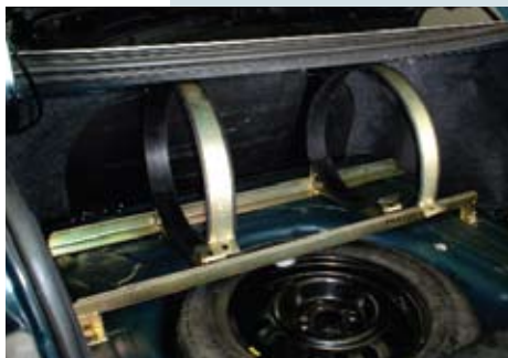
Suporte do cilindro de GNV