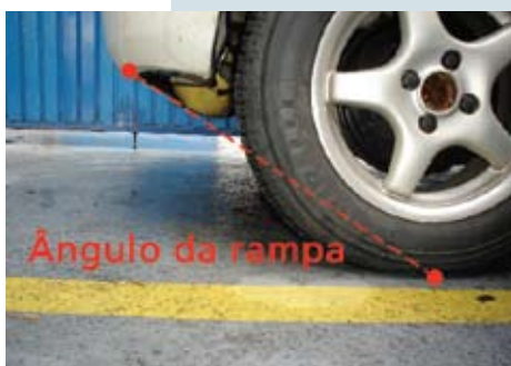
Ângulo de rampa do veículo; limite da instalação do cilindro sob o assoalho